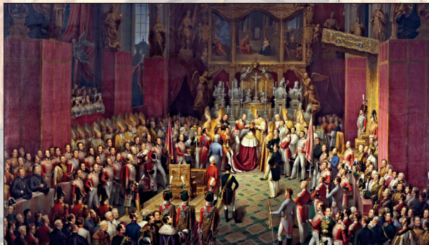
Koronovace Ferdinanda V. českým králem.